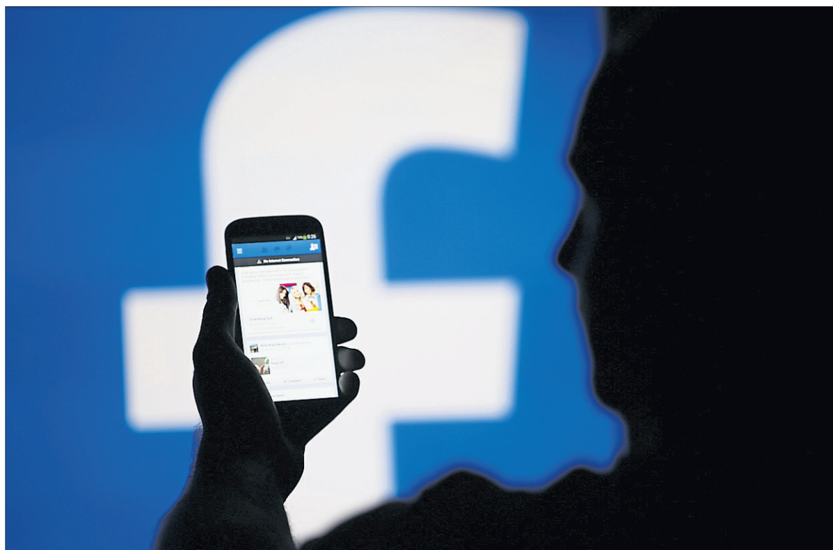
Ob die Regeln von Facebook über das Schicksal der Daten im Todesfall vor Gericht halten, ist fraglich.

Im Fall einer Mutter, die als Erbin der Userin von Facebook den Zugang zum Account der Tochter einklagte, um die Umstände des Ablebens durch Suizid zu erkunden, gab das LG Berlin der Klägerin Recht. Das Prinzip der Gesamtrechtsnachfolge, so das deutsche Gericht, habe auch für die höchstpersönlichen Daten im digitalen Nachlass des Erblassers zu gelten. Die gegenteiligen Regelungen der Nutzungsbedingungen seien in